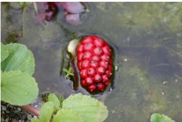
Bessen van Calla palustris .