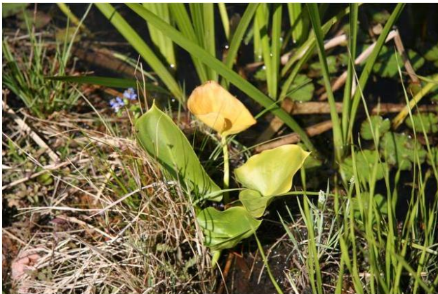
Calla palustris .

De echte aanleiding voor deze kleine bijdrage was echter het meegenomen zaad uit de bessen van slangenwortel Calla palustris , waarvan een juist uitgebloeide plant werd getoond en een half drijvende aar vol rode bessen. Tenslotte nog een opname van Aponogeton distachyos , dit jaar bloeiend tot in eind oktober.